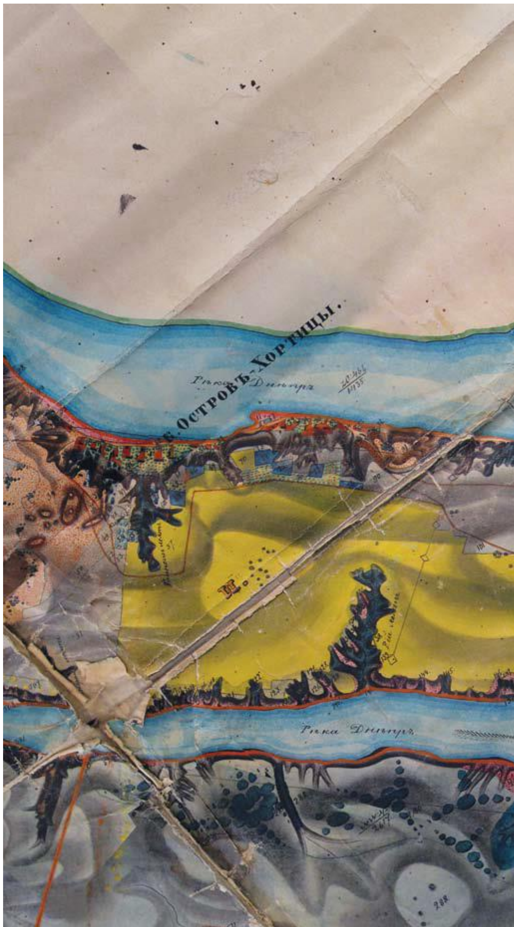
Иллюстрация: «План дачи колонии Хортицы...». Фрагмент 2.