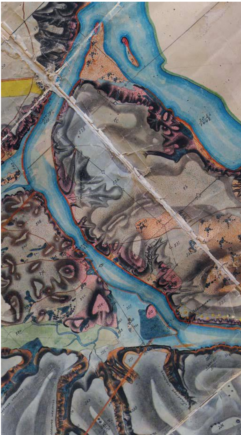
Иллюстрация: «План дачи колонии Хортицы...». Фрагмент 1.