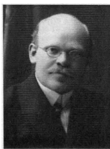
Завадский Пётр Як