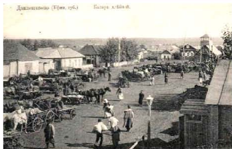
Давлеканово. Базар хлебный.