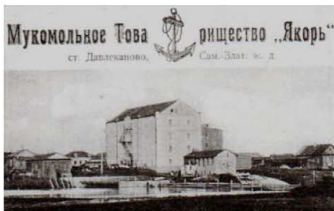
Давлеканово. Мукомольное товарищество «Якорь».