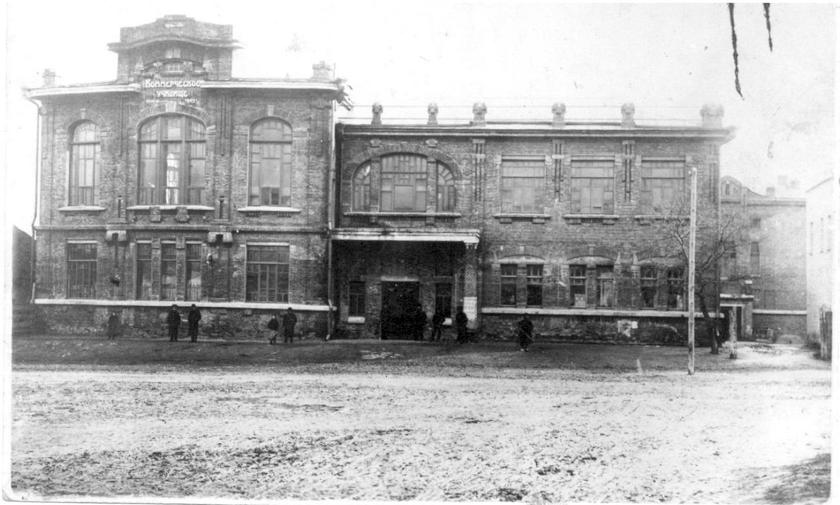
Коммерческое училище в Барвенково (фото 1917 г.)