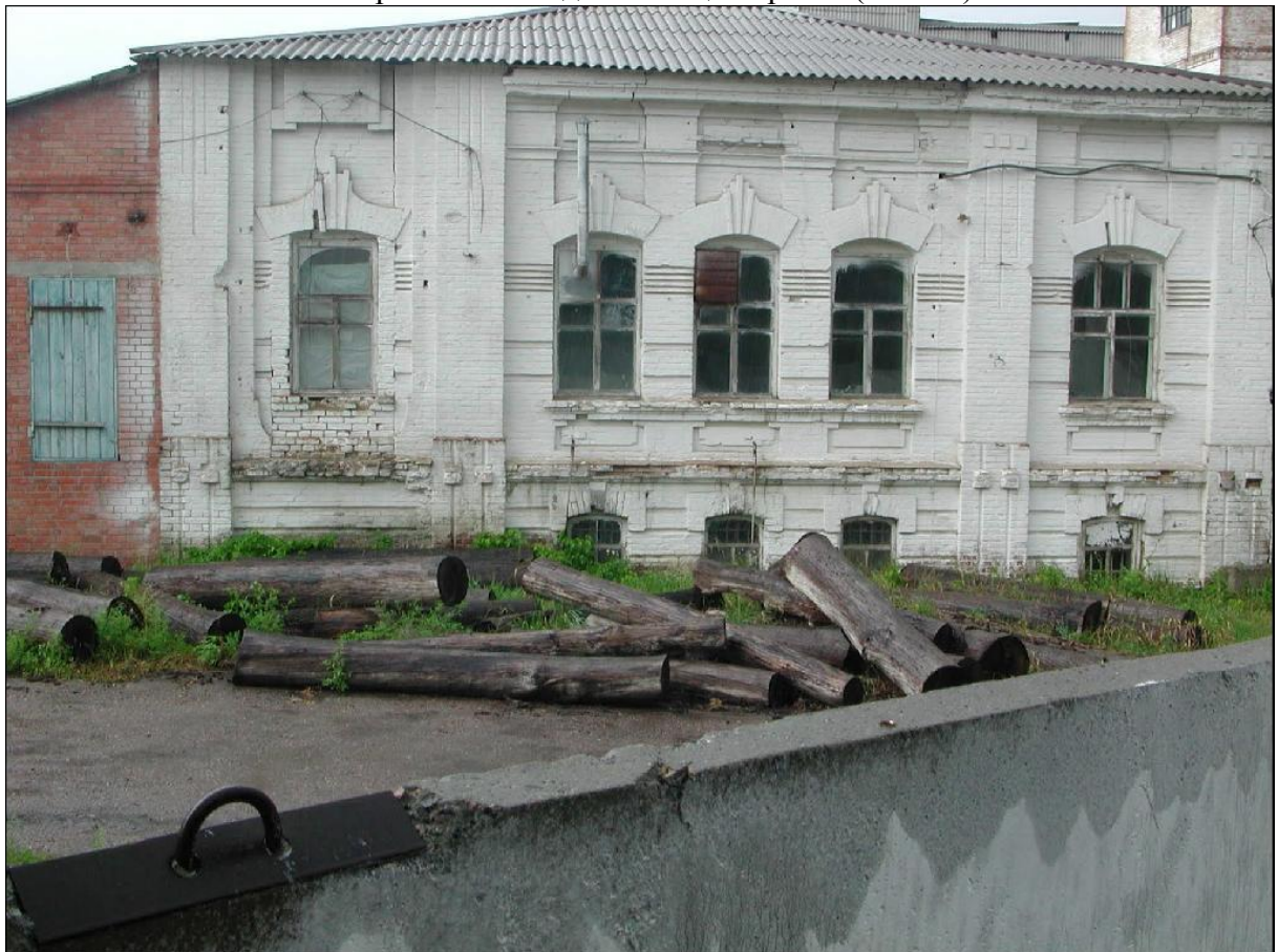
Совершенно вид дом Фрезов (мое предположение)