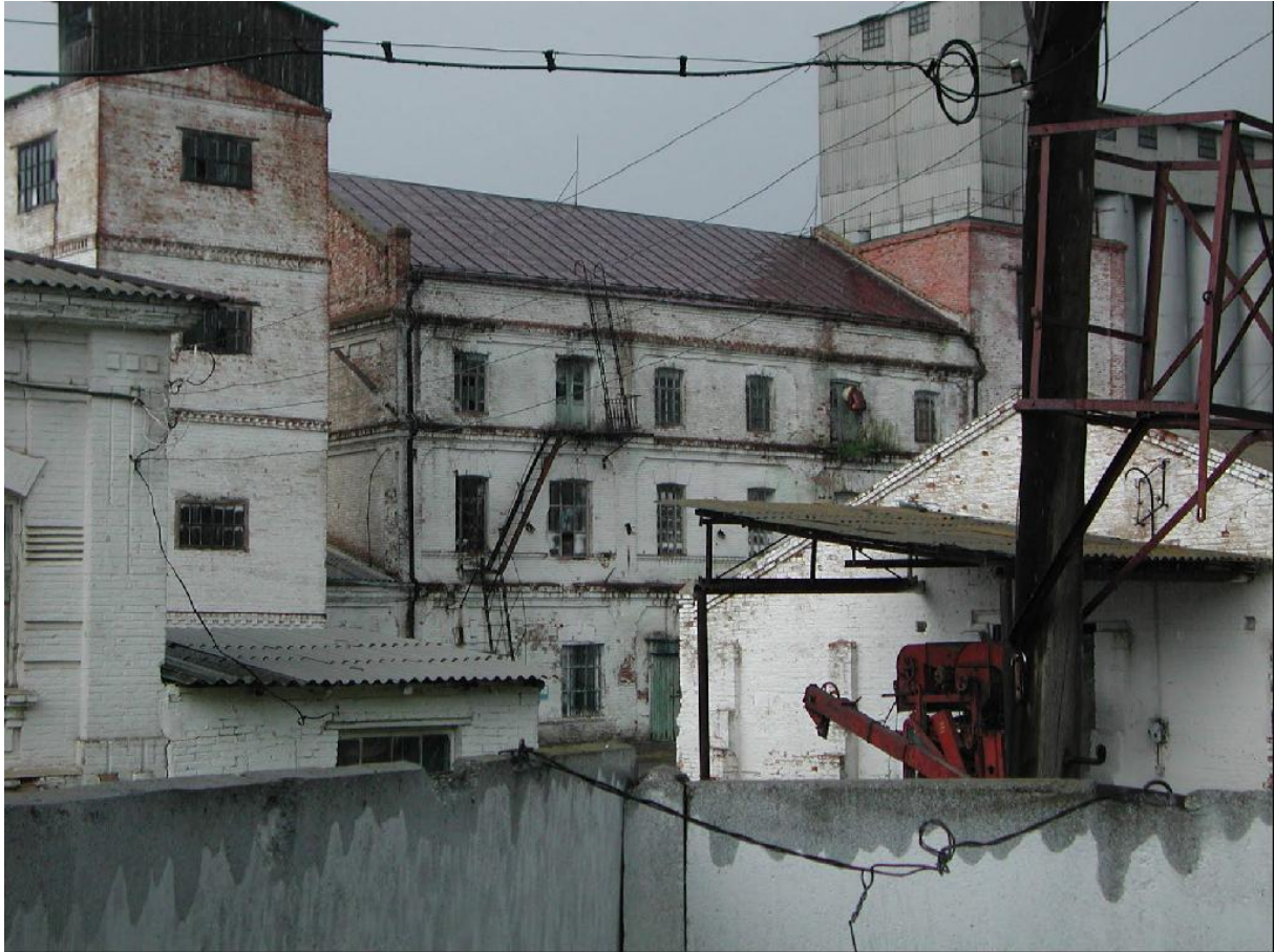
Совершенно вид мельницы Фрезов (2010 г.)