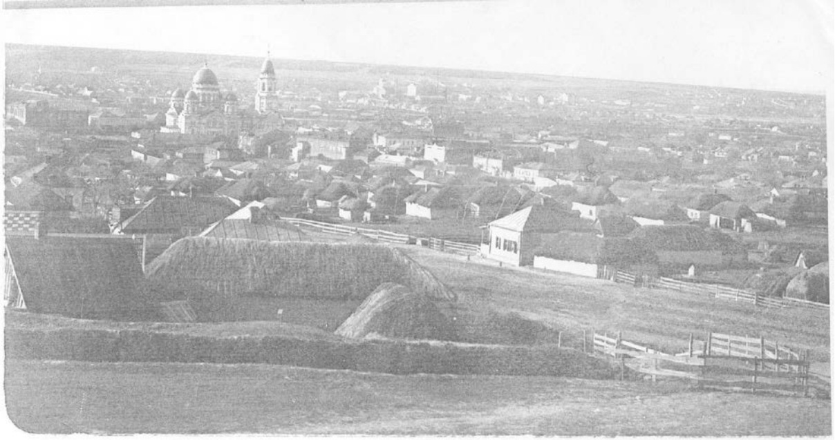
Общий вид слободы Барвенково в 1917 г. (на заднем плане в центре фото вдали - мельница Фрезов)