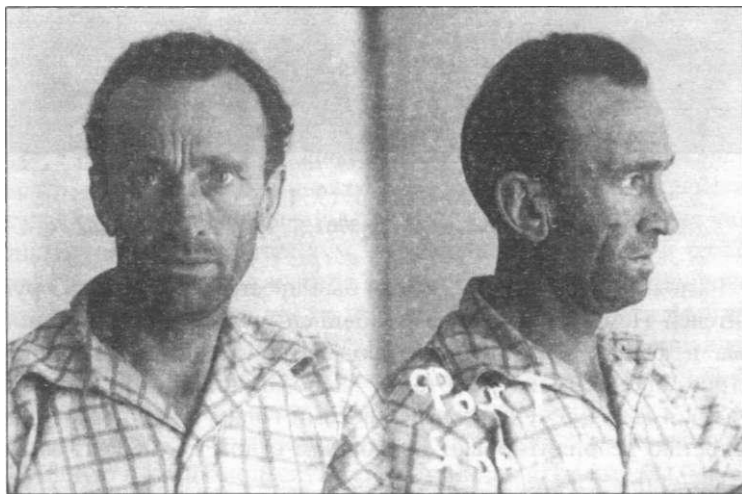
Я.И. Фогт, 1934 г. ОСДУАДААК. Ф.Р-2. Оп. 7. Д. 14580. Л. 55а. Подлинник.

24 мая 1989 г. прокуратура полностью реабилитировала Я.И. Фогта, а комиссия партийного контроля при Алтайском крайкоме КПСС 25 мая 1989 г. пришла к выводу, что Фогт Яков Иванович «подлежит восстановлению в партии» 1 .