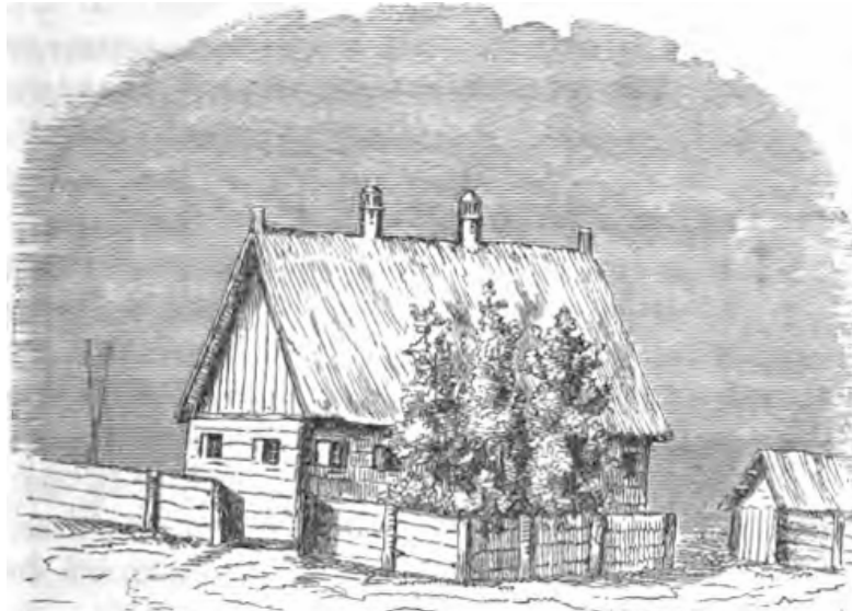
Haus eines nogaischen Tataren im Dorfe Akeima, nicht weit von der Mennoniten - Colonie.

Der Wirth des Gehöfts, ein schöner kräftiger Tatar, Vorsteher des Dorfs, empfing Herrn Kornies freundlich und ehrfurchtsvoll, und geleitete uns ins Haus. Die Einrichtung war ebenfalls nach dem Muster der Mennoniten, die Ausstattung der Küche und Wohnstube an Geschirr und Hausgeräth zwar nicht reichlich und altväterlich, wie bei den Mennoniten, aber doch auch nicht ganz ärmlich, es waren Tische und Stühle vorhanden, Kessel und Eimer, und sogar eine Eierkuchenpfanne! Da ich den Wunsch äußerte, die Weiber in ihrer Tracht zu sehen, so willfahrte unser Wirth auch diesem, einem Muselmanne gegenüber, eigentlich ganz ungebührlichen Verlangen. Er ging hinaus und kam nach einer Viertelstunde mit seinen drei auf das beste geputzten Weibern herein. Nur der Mund war wie bei allen muhomedanischen Weibern streng verhüllt. Sie waren jung, aber klein, dick, und nicht schön.